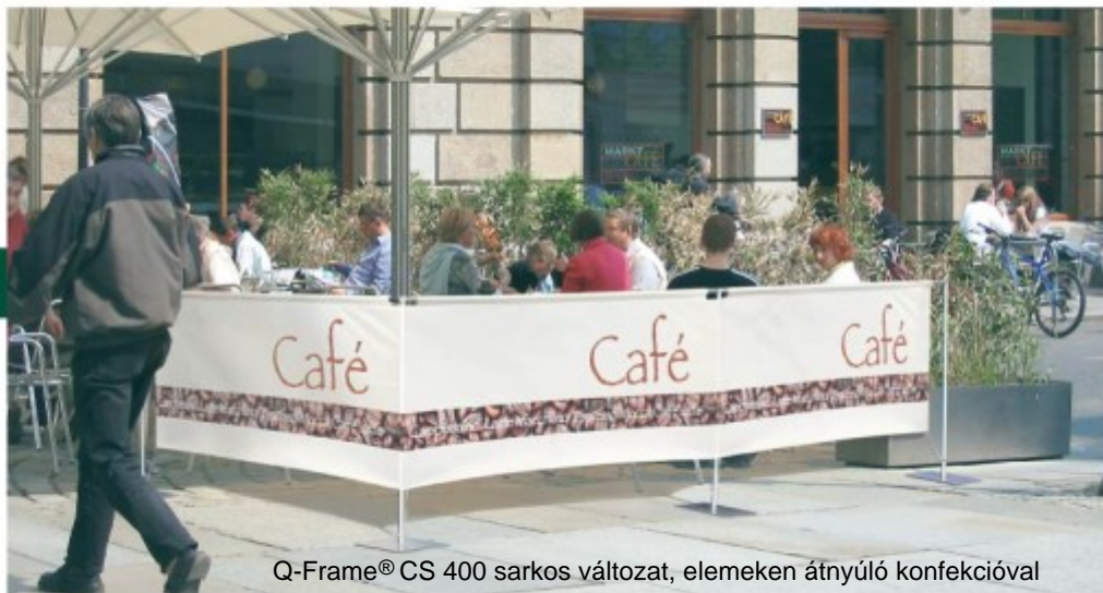
Q-Frame® CS 400 sarkos változat, elemeken átnyúló konfekcióval

Könnyen kihelyezhető reklámkerítés egyedi nyomattal. Kül- és beltéri használatra.