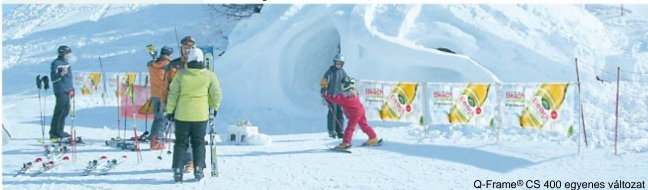
Q-Frame® CS 400 egyenes változat

Mivel termékeinket folyamatosan fejlesztjük, fenntartjuk a jogot az esetleges műszaki változásokra, ill. eltérésekre.